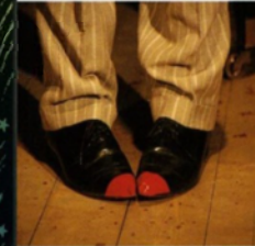
Liebe fängt in den spitzen an