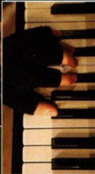
Der schwarze Zauberer