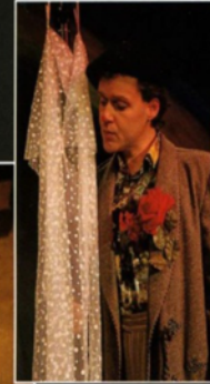
Sie hatte ein wunderschönes Kleid